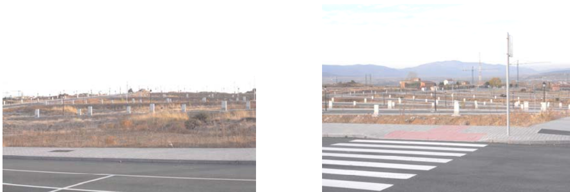
Imágenes del PP 4_Cerro Hervero. Número de viviendas previstas: 607.

Basta darse una vuelta por estos sectores de la ciudad para darse cuenta de que muchos de ellos aún no cuentan con un solo edificio. ¿Cuántas de estas viviendas están construidas? ¿Ha hecho este cálculo el equipo de gobierno? ¿Un 20%, un 30% por ejemplo? Pongamos un 40%. Esto supondría que están pendientes de ejecutarse un 60%, lo que se traduce en 9.351 viviendas, que a 2,9 ocupantes por vivienda nos salen 27.118, es decir que tenemos suelo urbanizado suficiente como para acoger a 27.118 personas más.